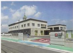
▲H27.4に開園したこうのとり東保育園