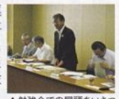
▲勉強会での冒頭あいさつ

議会の活性化に向け、議会運営委員会では、テーマを決めて事例研究を行っています。本年度は、豊田と八尾市を訪問、常任委員会の進め方などについて勉強しました。