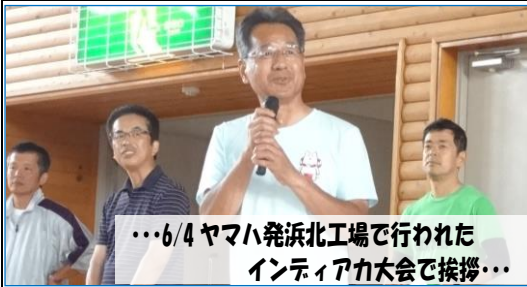
…6/4 ヤマハ発浜北工場で行われた インテリアカ大会で挨拶…

2016年7月15日 第43号 発行：松野まさひろ後援会 〒438-0025 磐田市新貝 2500 TEL0538-37-4561 発行者：羽木俊明